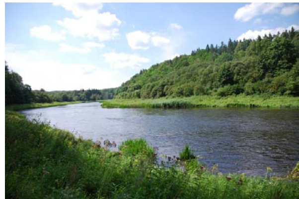
Ventai saimniecības teritorijā raksturīgs lēzens krasts