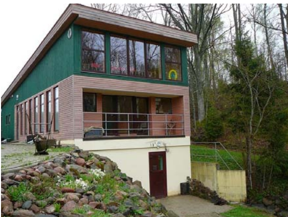
Zivju mājas pirmajam līmenim cauri plūst Bērzenes upes ūdeņi, otrajā līmenī izbūvēta semināru zāle

Saimniecība nodarbojas ar tīršķirnes un krustojumu liellopu audzēšanu vaislai, nobarošanai un gaļas ražošanai, ar piena sivēnu pārdošanu un cūkgaļas ražošanu, graudaugu un pārtikas kartupeļu audzēšanu, kā arī biškopību. Saimnieki jau vairākus gadus sešos saimniecības dīķos audzē karpas, līņus un orfas. Ziemas sezonā zivis var ķert speciālos zivju mājas baseinos, kas izveidoti, uzpludinot Bērzenes upes līkumu.