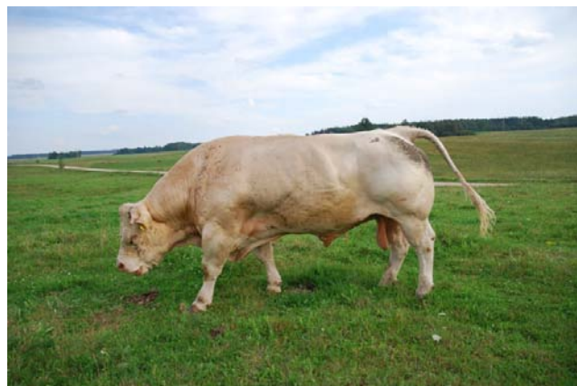
Šarolē tīršķirnes bullim raksturīgs izteikts muskuļu reljefs