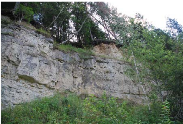
Iežu atsegumi Ventas ielejā

Saimniecības lielāko daļu klāj dažāda vecuma atmatas un graudaugu sējumi. Salīdzinoši nelielā saimniecības daļā (~10 – 15 %) – Bērzenes un Ventas upju ielejās, ir koncentrējušās izcilas dabas vērtības – iežu atsegumi un alas, nogāžu un gravu meži, no stāvajām nogāzēm iztek daudz avotu un strautu. Alās mīt sikspārņi, savukārt iežu atsegumi atklāj būtisku informāciju par senākiem laika periodiem – Ketleru atsegumā atrastas bruņuzivs fosilijas. Nogāžu mežiem piemīt augsta bioloģiskā vērtība. Ventas ielejas augšējā daļā savulaik pletušās sugām bagātas parkveida ganības, par ko mūsdienās liecina jaunākiem kokiem ieskauti bioloģiski veci ozoli ar lieliem vainagiem. Ventas palienē saglabājušies atsevišķi augu sugām bagāti zālāji, savukārt Ventas krastam piekļaujas krāšņa augstu lakstaugu josla.